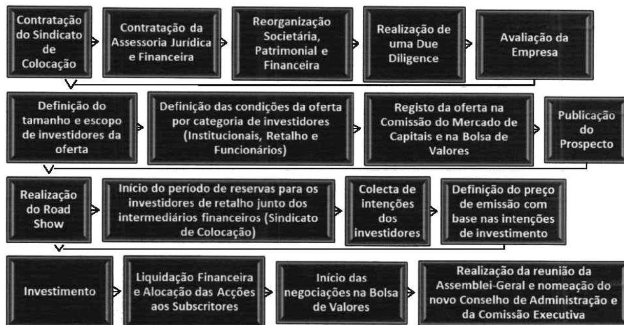
Figura 1 - Roteiro para Oferta Pública Inicial

21. Este procedimento segue o seguinte fluxo 3 :