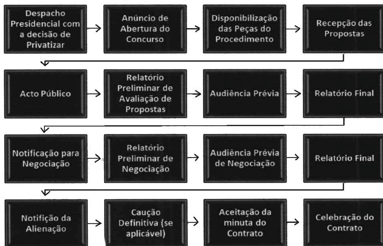
Figura 3 - Roteiro para Concurso Público

23. Este procedimento segue o seguinte fluxo 5 :