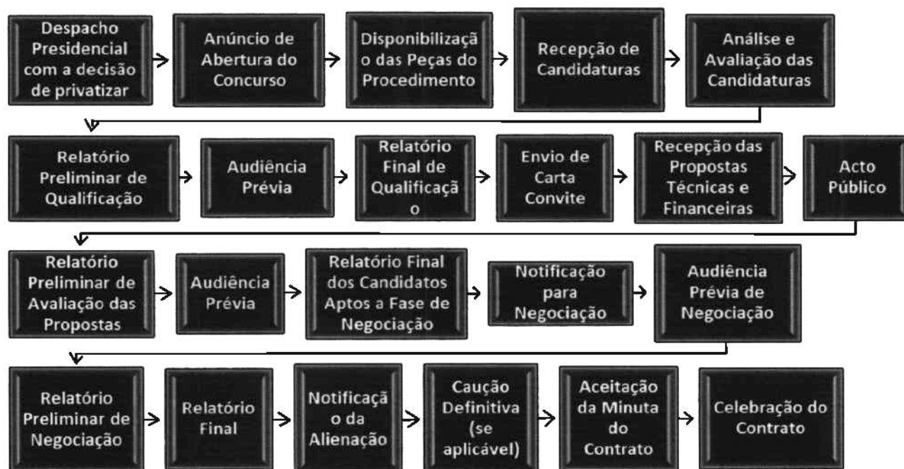
Figura 4 - Roteiro para Concurso Limitado por Prévia Qualificação

24. Este procedimento segue o seguinte fluxo 6 :